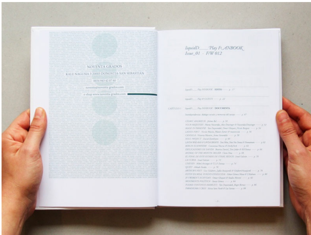
Fanbook by liquidDocs