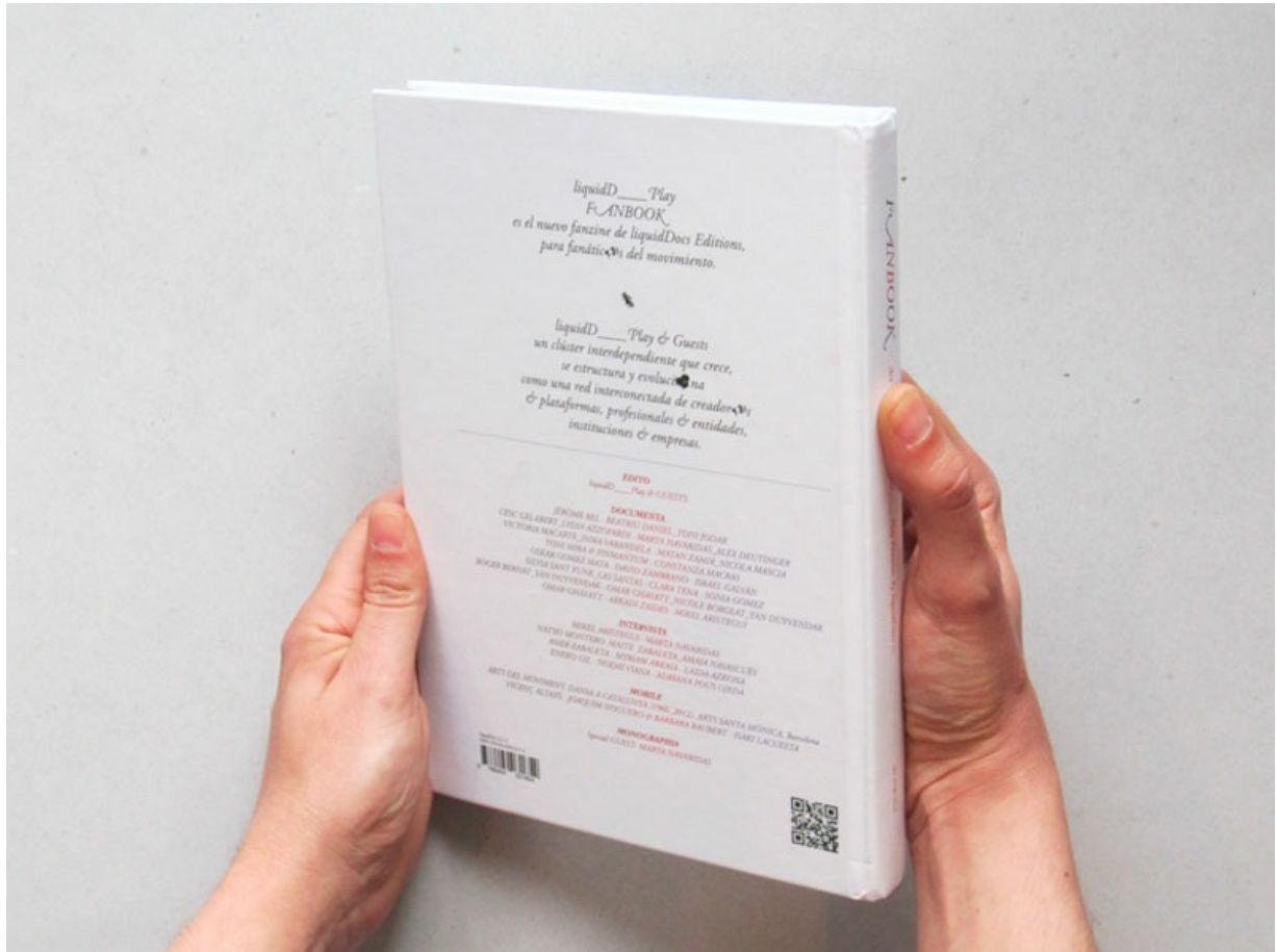
Fanbook by liquidDocs