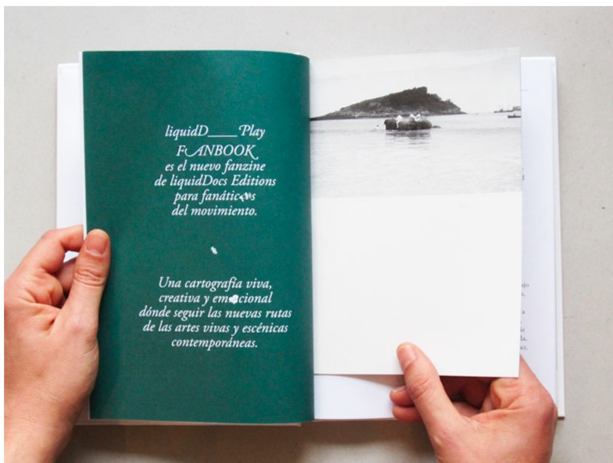
Fanbook by liquidDocs