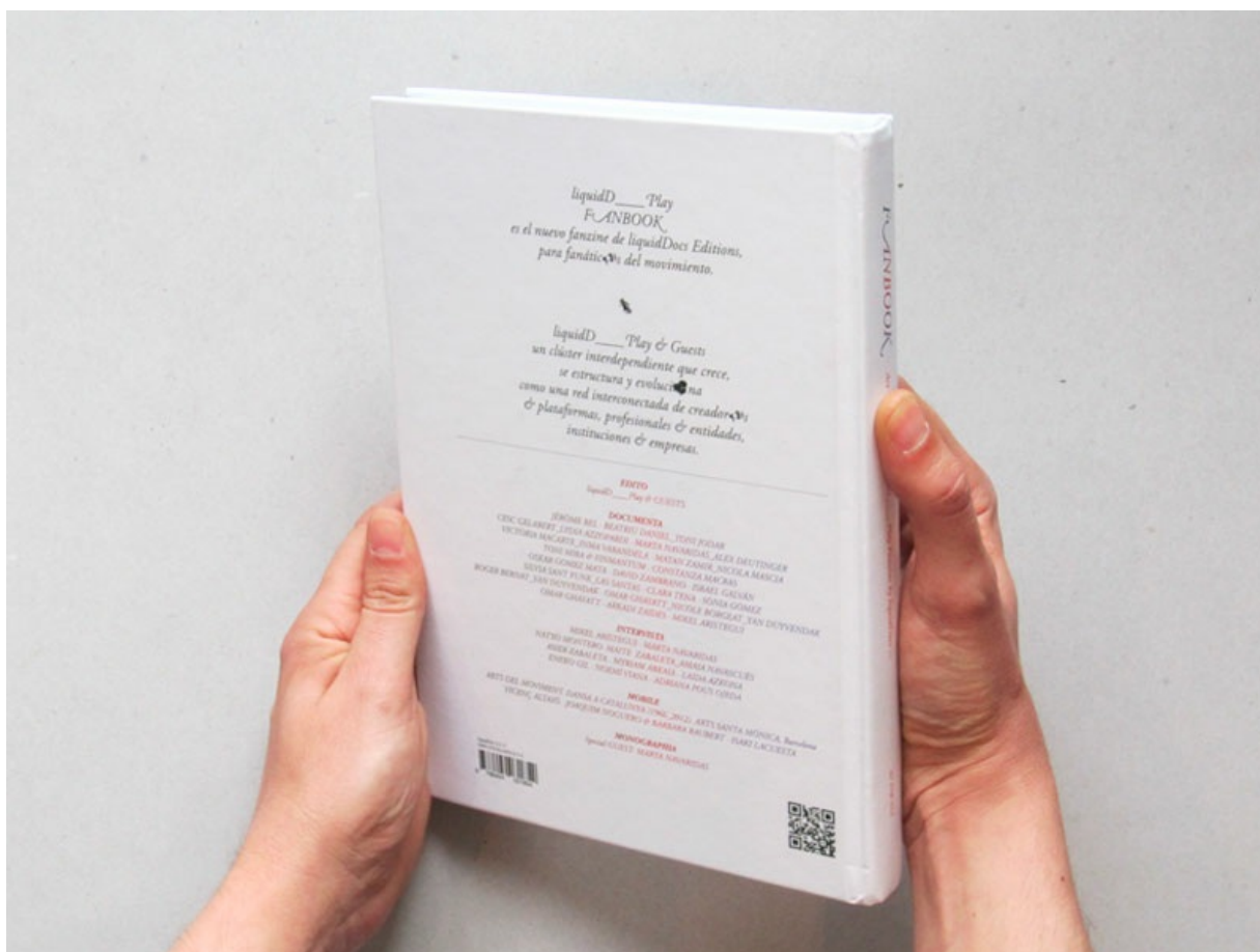
Fanbook by liquidDocs