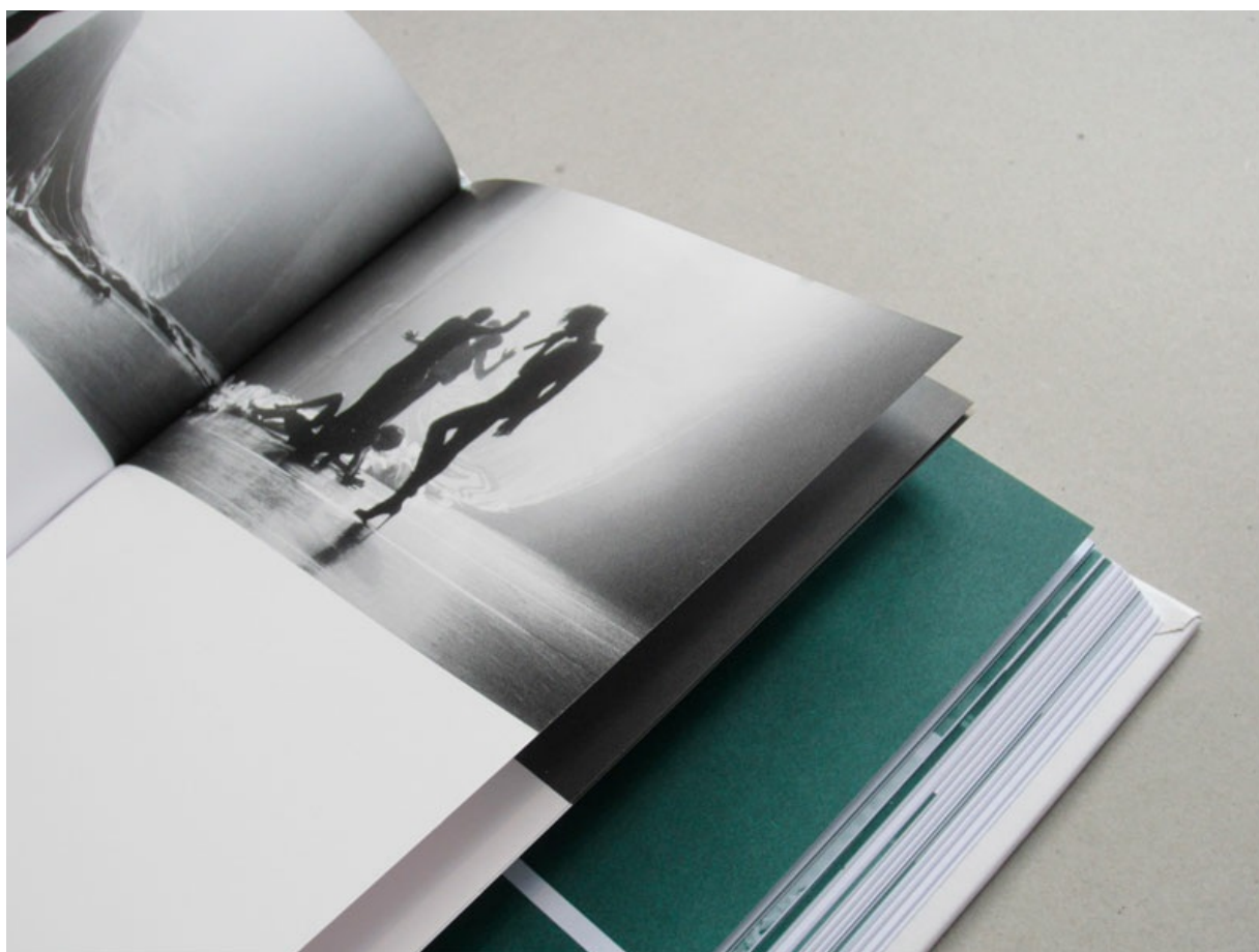
Fanbook by liquidDocs