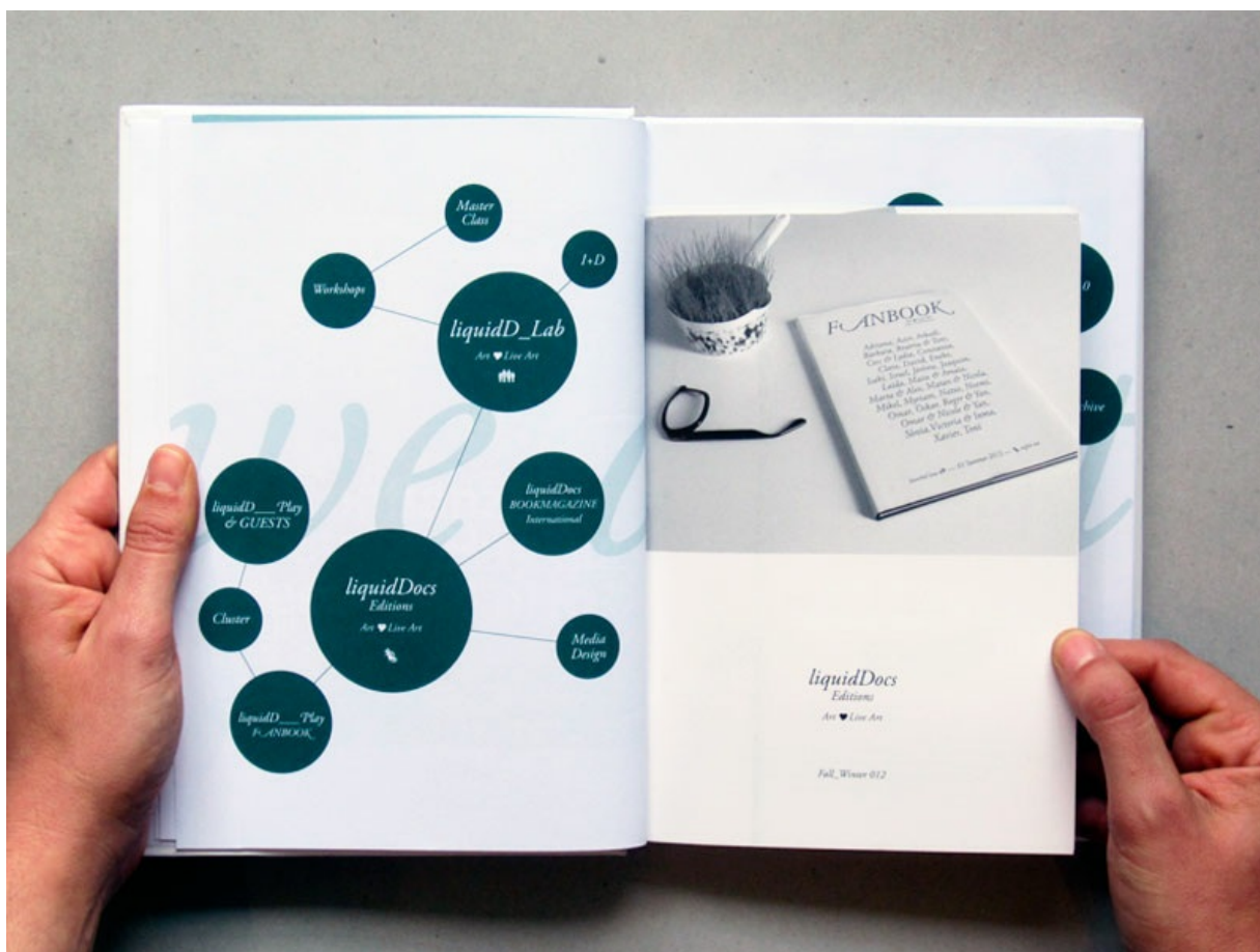
Fanbook by liquidDocs