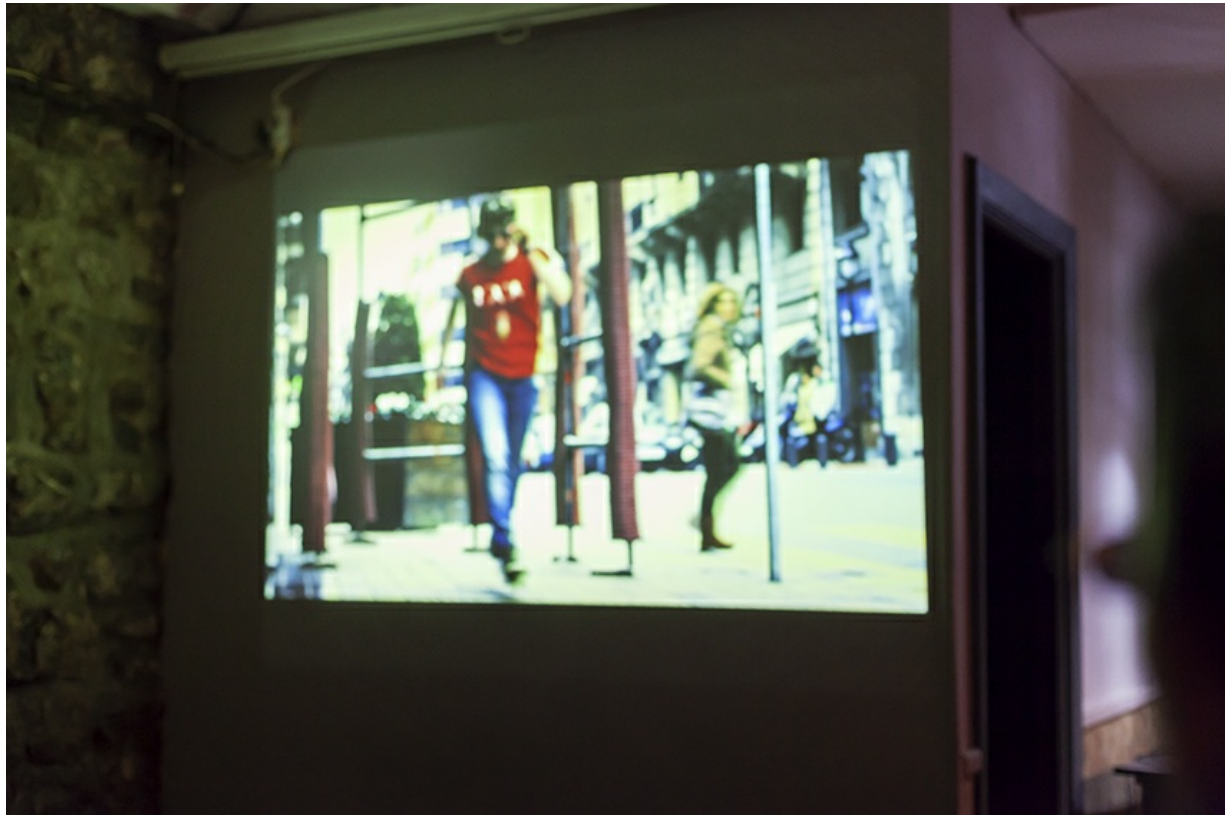
Sra. Polaroiska – Pilota Girls - Arraun.