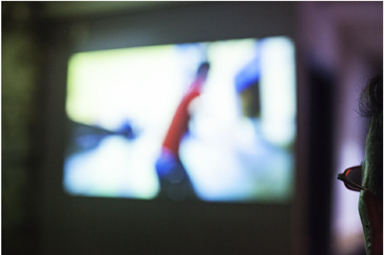
Sra. Polaroiska – Pilota Girls - Arraun.