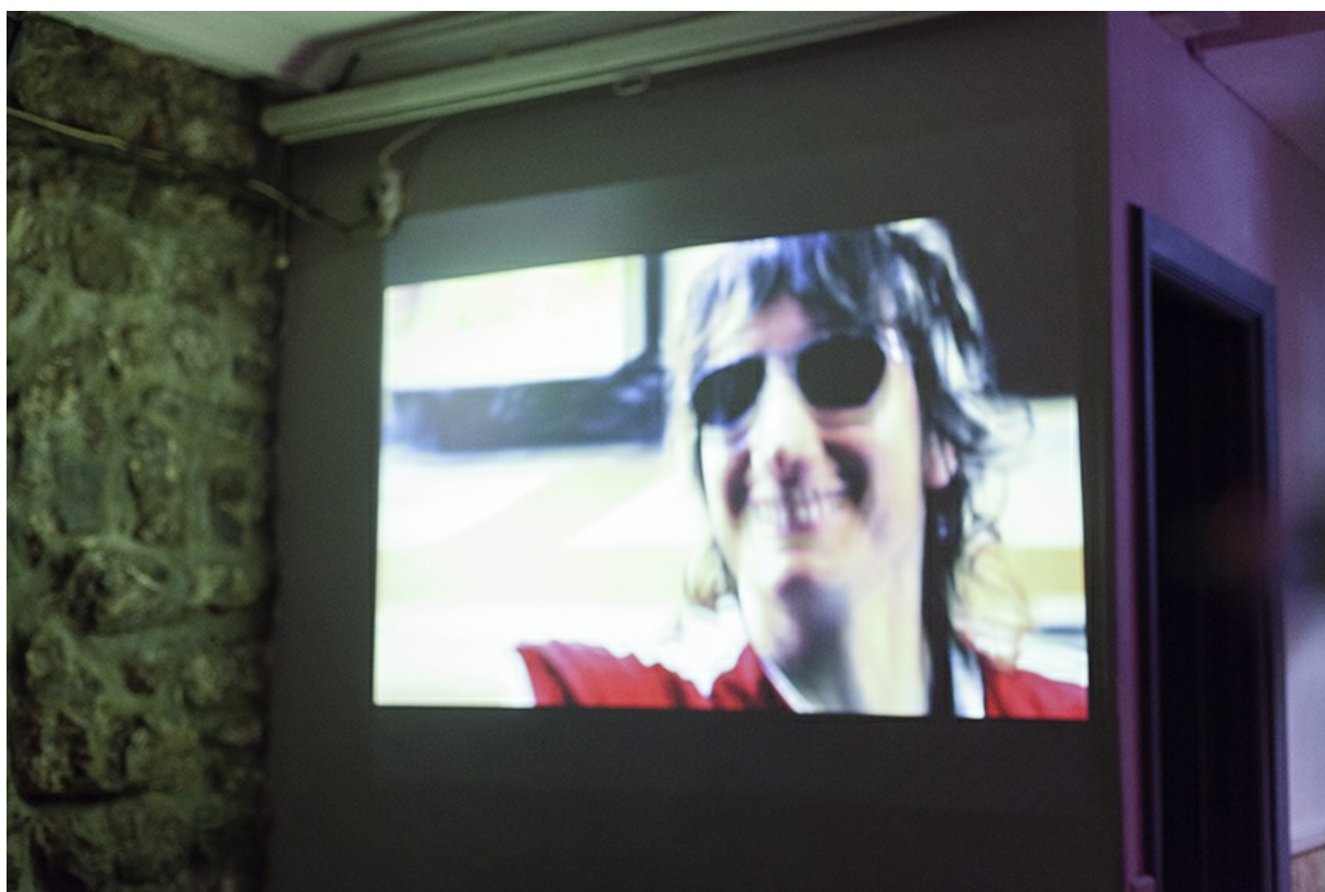
Sra. Polaroiska – Pilota Girls - Arraun.