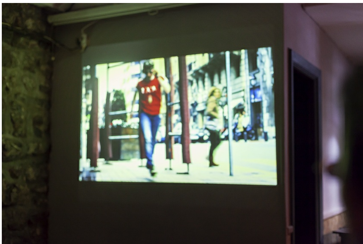
Sra. Polaroiska – Pilota Girls - Arraun.